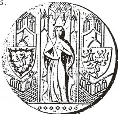
Seal of Euphemia, Countess of Ross and wife of Robert II.

In de geschiedenis van Clan Ross zijn er zeker zeven Euphemia's die een belangrijke rol hebben gespeeld. Wellicht de belangrijkste rol speelde Euphemia, dochter van Hugh, 4e Earl of Ross en Margaret Graham.