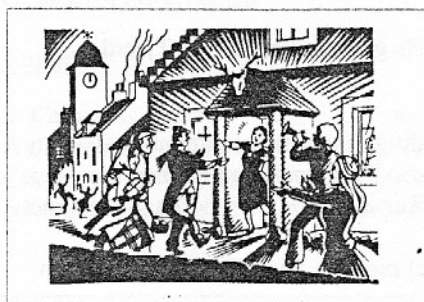
First Footing na klokslag twaalf

Na de twaalfde galmslag van de kerkklok klinkt uit miljoenen kelen het befaamde lied van vriendschap van Robert Burns, Auld Lang Syne . Om het huis geluk te brengen, moet de eerste bezoeker die daarna over de drempel komt een lange donkere man zijn met een fles whisky en een klompje turf of