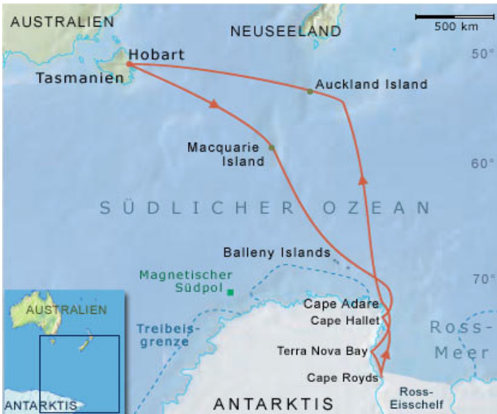
Hierboven: De omgeving (Antarctica) waar de Rosszeehond leeft.

Hij (of zij) heeft een korte snuit, brede kop, grote ogen en een uitstulping onder de kin. Hij heeft zeer lange achterste flippers. Wanneer mensen op het ijs in de buurt komen vertonen ze in eerste instantie geen enkele reactie. Pas als iemand binnen een straal van 5-10 meter komt richt hij/zij zich op en maakt met open mond vreemde klikkende en klokkende geluiden. Ze vertonen verder geen agressie tegenover mensen.