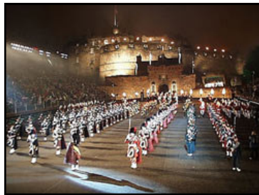
Beelden van de Tattoo in 2005.

De BBC zendt de Tattoo uit op zaterdag 26 augustus om 5.35 pm ( 18.35 Nederlandse tijd).